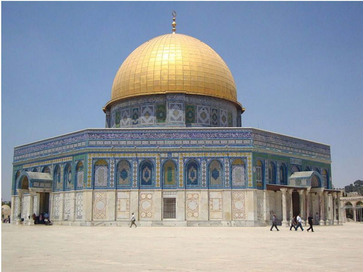
Cúpula da Rocha em Jerusalém.