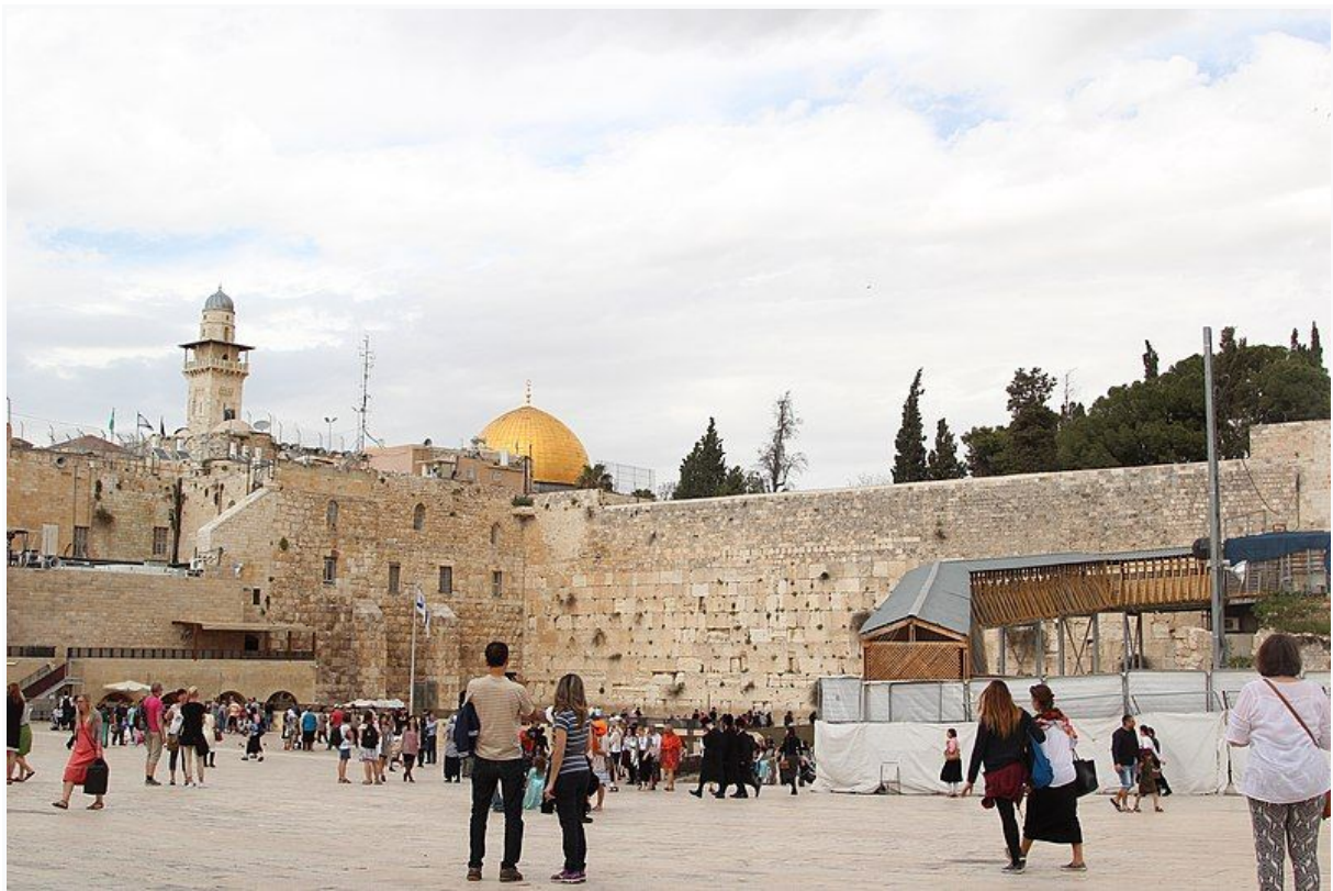
Muro das Lamentações.