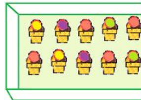
OS NETOS DO SENHOR PAULINO