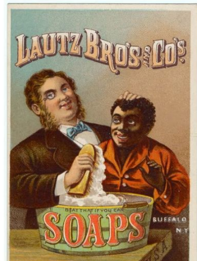
2- Propaganda de sabão. Homem branco usa sabão para lavar menino negro.

www.propagandashistoricas.com.br/2014/08/lautz-bros-cos-soap-propaganda-racista.html