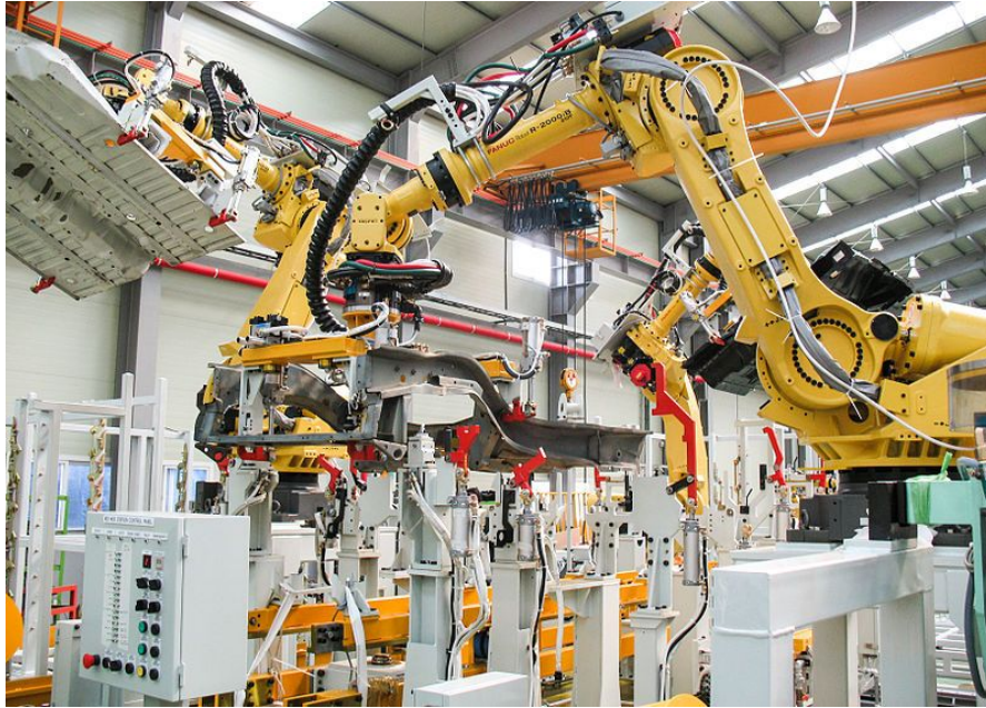
Imagem 01: robotização