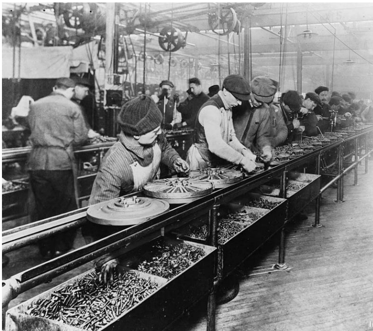
Imagem 02: Ford - linha de montagem em 1913.

https://pt.wikipedia.org/wiki/Automa%C3%A7%C3%A3o#/media/File:FANUC_R2000iB_AtWork.jpg