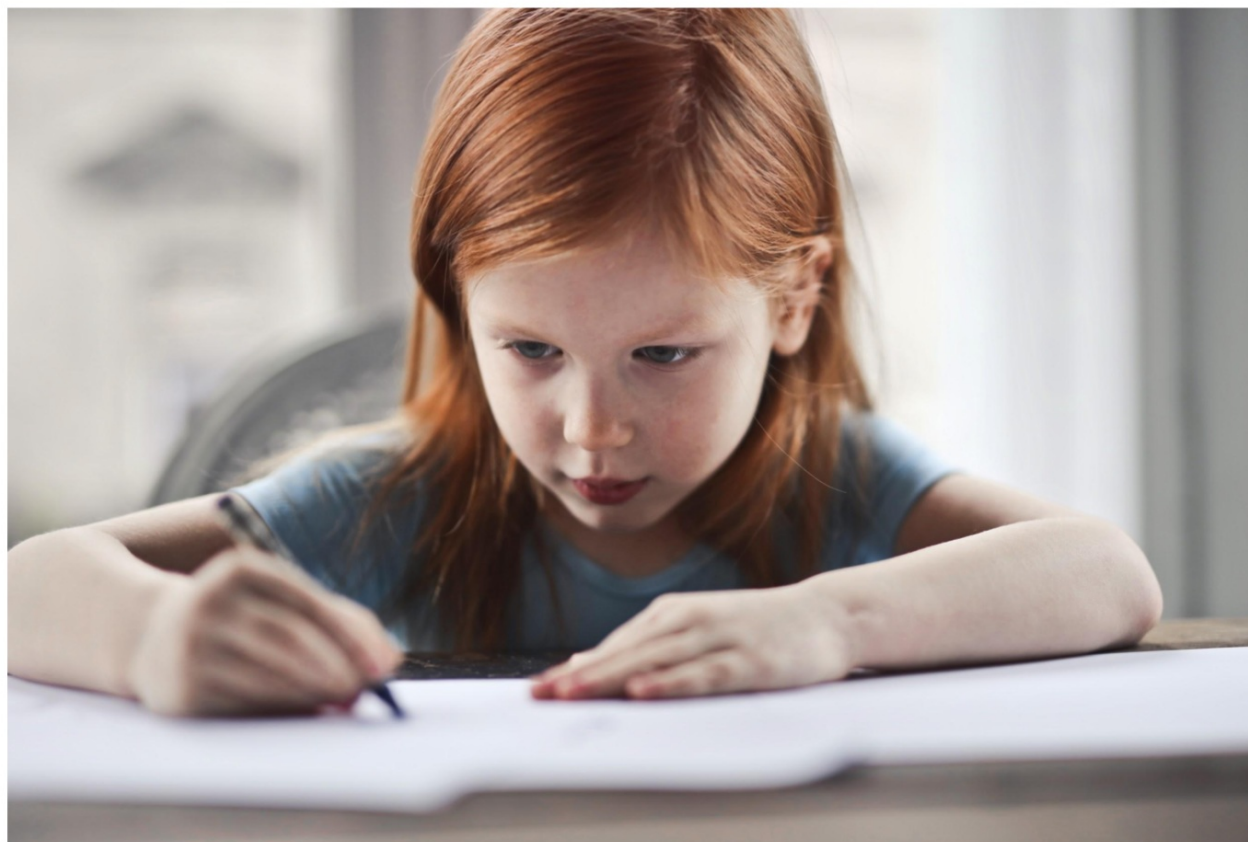
Pexels, Bruce Mars

http://portal.iphan.gov.br/ (Acessado em 13/03/2019)