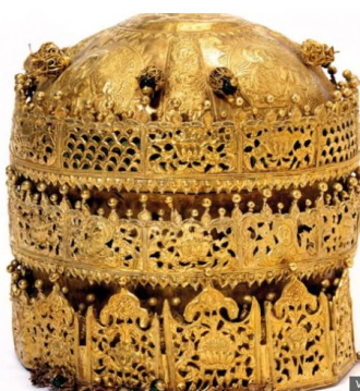
Esta coroa é admirada pela riqueza de detalhes e as imagens religiosas esculpidas nas laterais