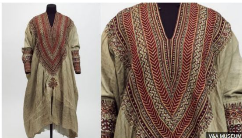
Feito em 1860, esse traje de casamento teria pertencido à rainha Woyzaro Terunesh

Parte desses tesouros ficou no museu Victoria and Albert, em Londres.