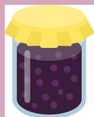
GELÉIA R$ 8,00