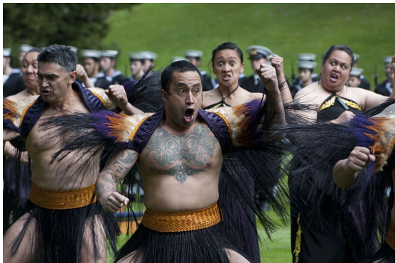
Maoris dançando a Haka, dança guerreira.

O povo maori é originário da Polinésia, um conjunto de ilhas situado a leste da Austrália. Eles habitam a Nova Zelândia e são conhecidos por suas marcantes tatuagens faciais e danças guerreiras. Mesmo após o contato com os europeus, em 1642, eles mantiveram sua crença mitológica.