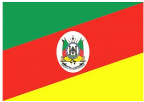
RIO GRANDE DO SUL