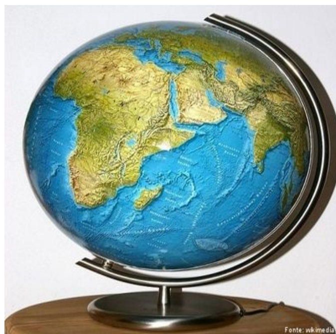
Imagem 02: Globo terrestre

Fonte: SECRETARIA DE EDUCAÇÃO DO PARANÁ, Globo terrestre físico. Disponível em: < http://www.geografia.seed.pr.gov.br/modules/galeria/detalhe.php?foto=1074&evento=1 > Acesso em: 16 jan. 2019.