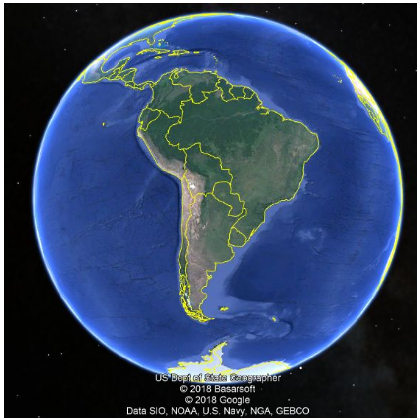
Imagem: 01: Imagem satélite

Fonte: Google Earth . Disponível em: < https://www.google.com.br/intl/pt-PT/earth/ > Acesso em: 15 jan 2019.