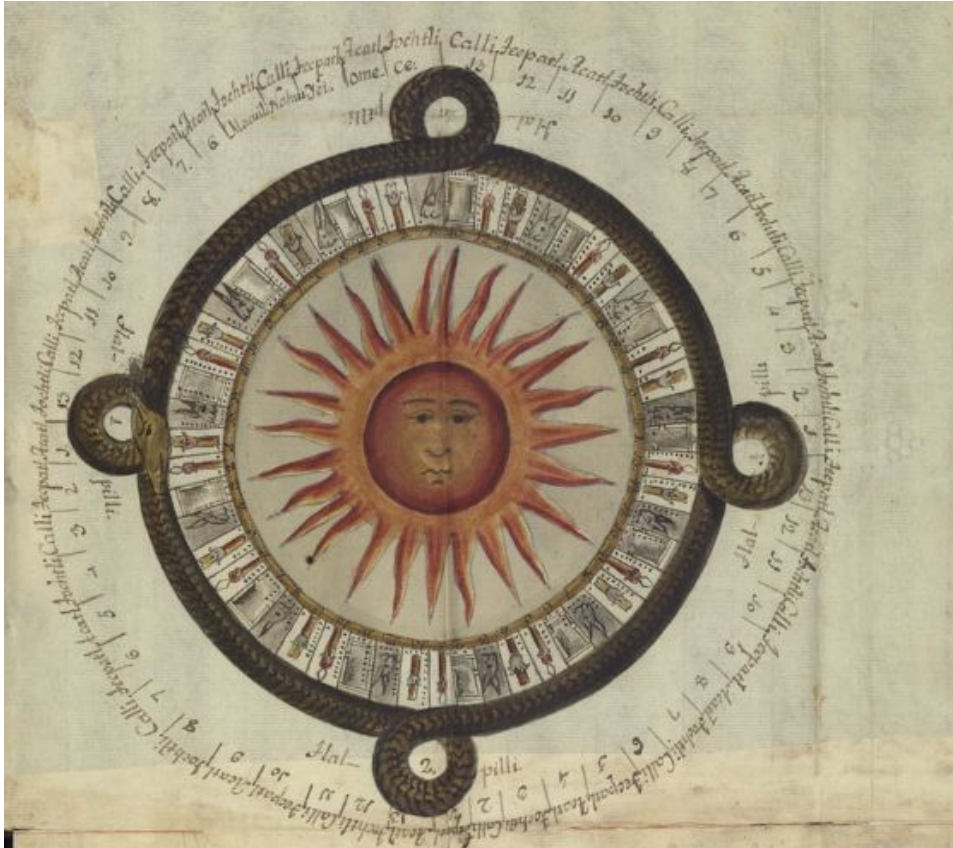
Imagem 2: Exemplo do calendário maia, conhecido como Tzolkin,

Representa o calendário asteca, feito de pedra, encontrado durante a restauração da praça principal do México, em 1790.