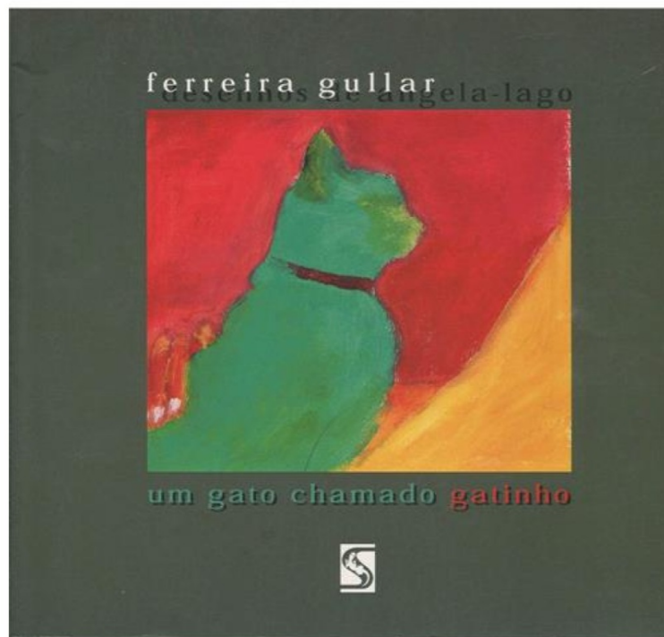
Capa do livro "um gato chamado gatinho", de Ferreira Gullar. Editora Salamandra