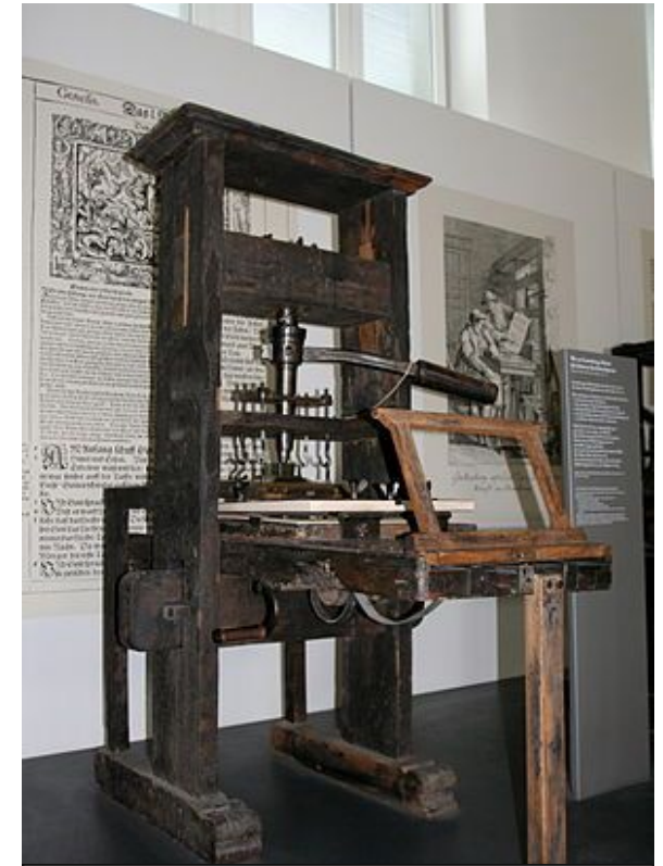
Modelo de prensa móvel de 1811, mesmo modelo inventado por Johann Gutenberg, por volta de 1450. A prensa permitiu a reprodução de várias páginas de forma sequencial, algo nunca visto até então.

Modelo de prensa móvel de 1811, mesmo modelo inventado por Johann Gutenberg, no período do renascimento. Link: https://pt.wikipedia.org/wiki/Prensa_m%C3%B3vel#/media/File:Handtiegelpresse_von_1811.jpg . Acesso em: 25/11/2018.