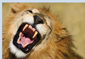
Um leão boceja, exibindo suas enormes presas.