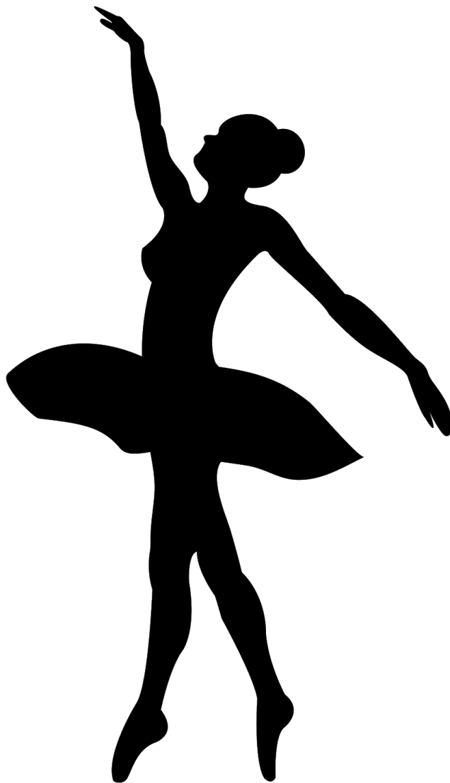
Imagem 1 - silhueta em sombra de uma bailarina.

Confecção dos personagens da lenda para o teatro de sombras: copiar ou colar as imagens em um papel cartão preto ou em uma cartolina, recortar e colar em um palito de churrasco com uma fita adesiva.