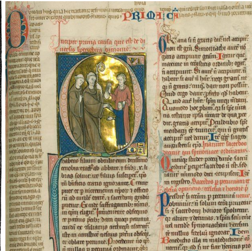
Página de manuscrito medieval com iluminuras(pinturas)