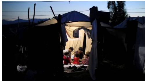
Migrantes passam a noite em campo de refugiados na ilha de Lesbos, na Grécia: apesar de manifestações anti-imigratórias, pesquisa afirma que maioria europeia é a favor de refugiados

Reuters e AFP 19/09/2018 - 13:26 / Atualizado em 19/09/2018 - 14:30