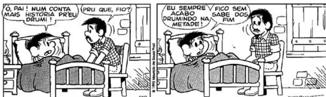
Copyright ©1999 Mauricio de Sousa Produções Ltda. Todos os direitos reservados.