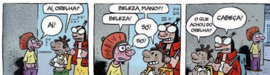
(Angeli. Luke & Tantra — Sangue bom. São Paulo: Devir/Jacaranda, 2000. p. 17.)