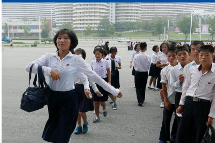
Jovens chegam para assistir a uma apresentação do circo, em Pyongyang