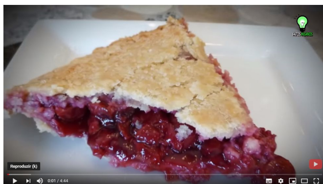
TRUQUES USADOS EM PROPAGANDAS PRA ENGANAR VOCÊ

Em seguida assista ao vídeo “Truques usados em propagandas para enganar você” até os 4 minutos. Link: