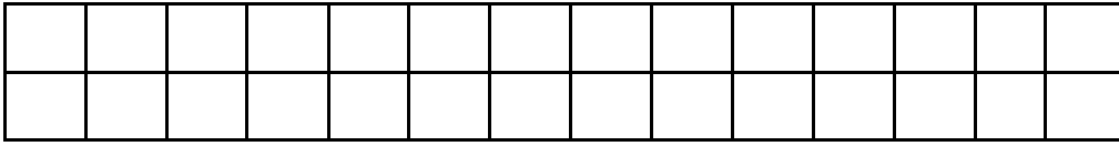
Malha quadriculada 2cm X 2cm