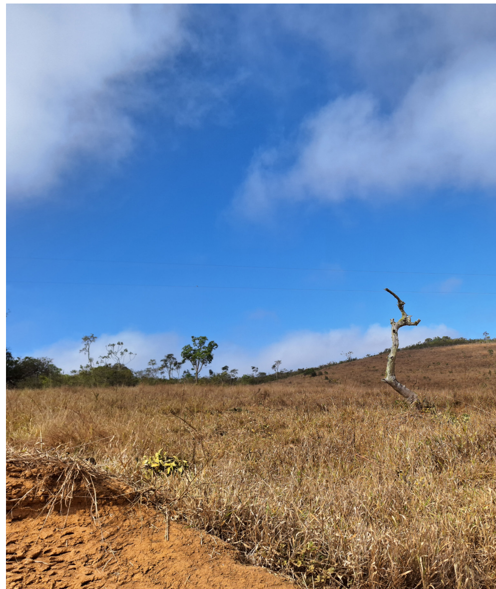
Vegetação queimada após incêndio no cerrado.

Hidrografia: Rica em nascentes de importantes rios como o São Francisco, Tocantins e Paraná, sendo considerado a “caixa d’água do Brasil”.