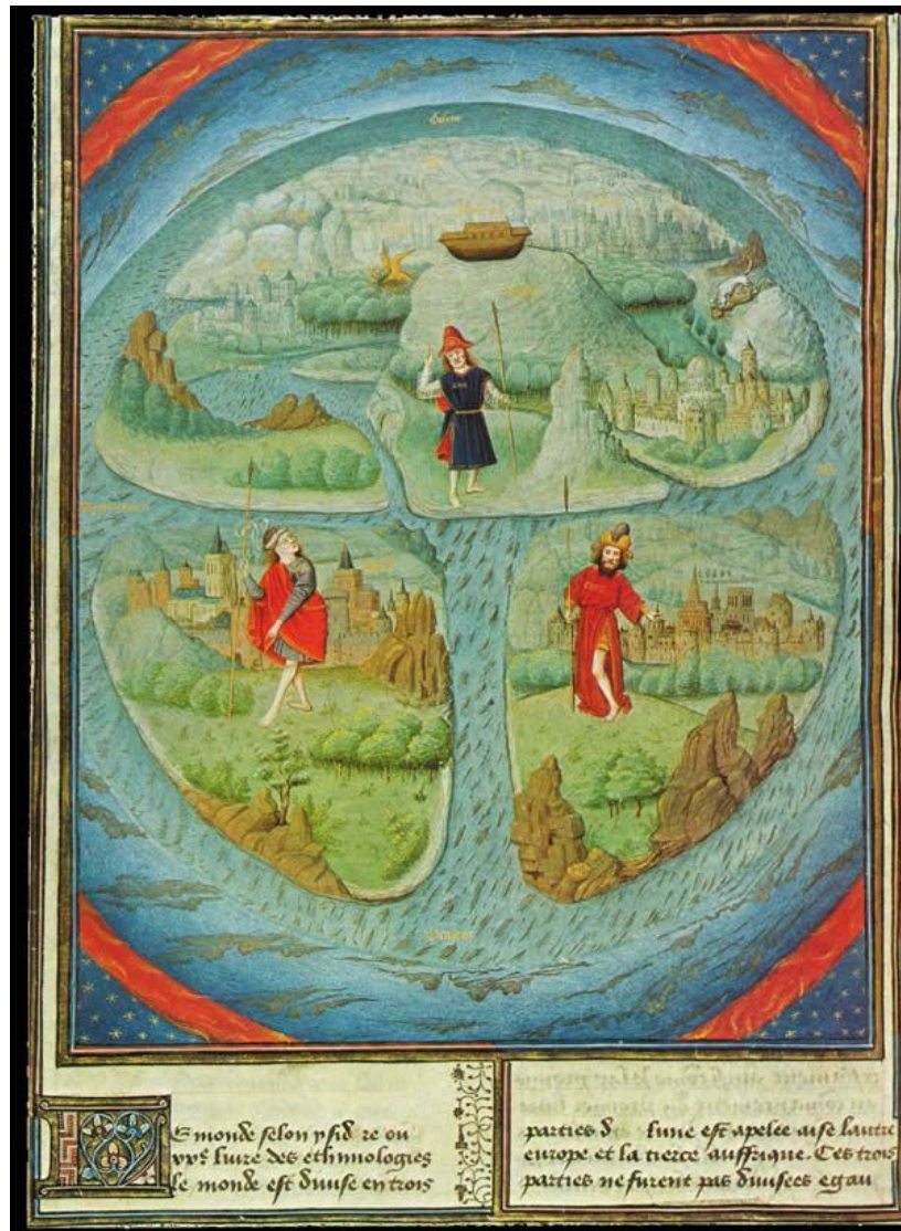
Mapa-múndi, atribuído a Jean Mansel. Iluminura contida no manuscrito La fleur des histories . 1459-1463. Disponível em: https://upload.wikimedia.org/wikipedia/commons/5/5f/T-O_Mappa_mundi.jpg .

Segundo esta passagem a Ásia teria sido ocupada por Sem (parte superior), a África teria sido ocupada por Cam (parte inferior direita) e a Ásia (parte inferior esquerda), por Jafé.