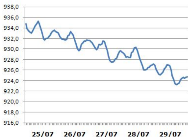
Tabela hora (H) x dia (D) e gráfico correspondente, com os valores de pressão atmosférica (em hPa) durante os dias 25 a 29 de julho de 2018. Dados gentilmente cedidos pela equipe do IAG-USP