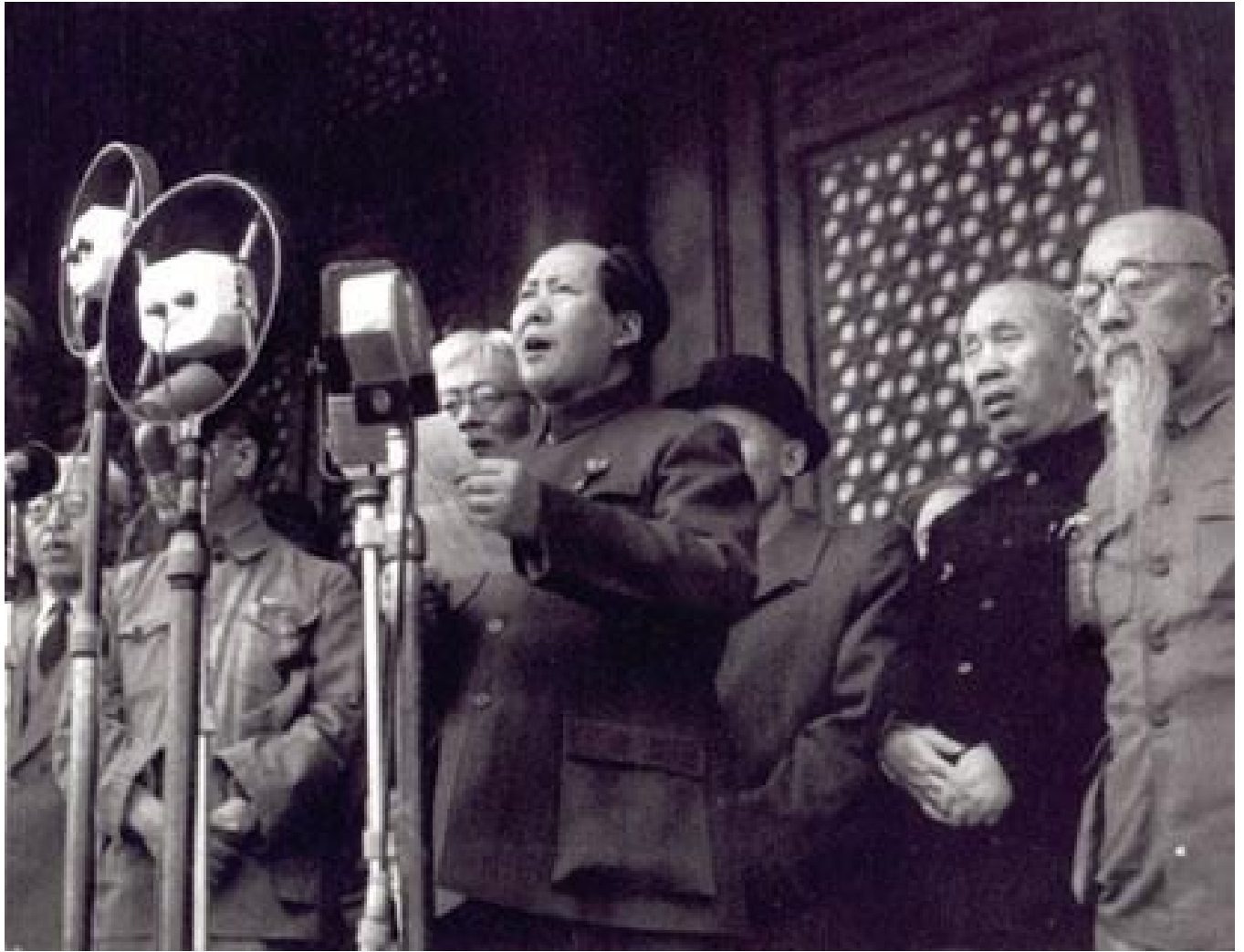
Mao Tse-tung proclamando a fundação da República Popular da China em 1 de outubro de 1949 em Pequim.