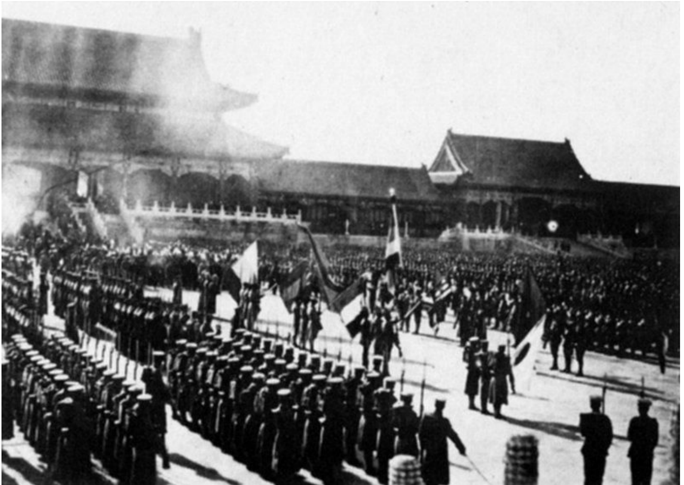
Tropas Estrangeiras na Cidade Proibida durante a Revolta dos Boxers.