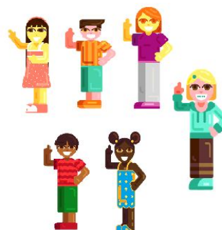
NETOS DO SEU MANOEL