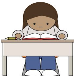
Sala de aula

https://www.google.com.br/url?sa=i&source=images&cd=&cad=rja&uact=8&ved=0ahUKEwiNhc2T_pPgAhWGKLkGHUYZafMQMwgnKAAwAA&url=https%3A%2F%2Fpixabay.com%2Ffi%2Ftuloste-laite-tulostin-inkjet-34871%2F&psig=AOvVaw2N_Sryw9SPb-ppQo0cehF6u&ust=1548885471097128&ictx=3&uact=3