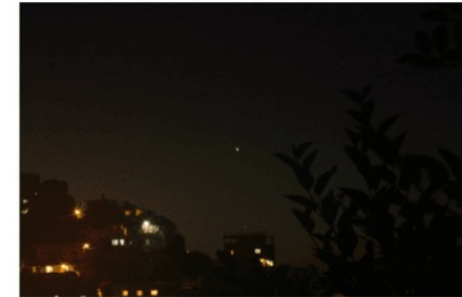
Alcione Caetano / Time de Autores