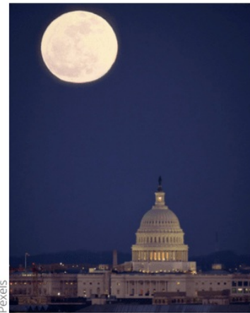
Figura 2: Lua no céu durante a noite