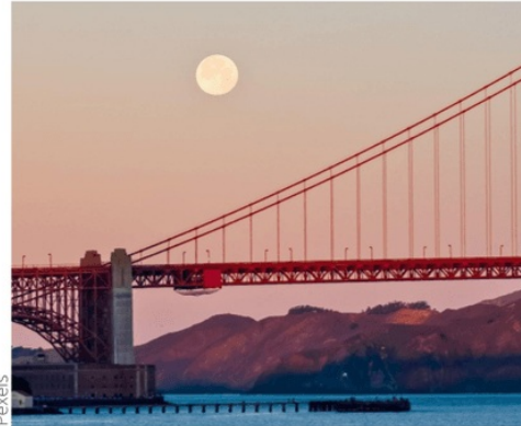
Figura 1: Lua no céu durante o dia

Materiais necessários: Impressão dos slides, caso não possua projetor.