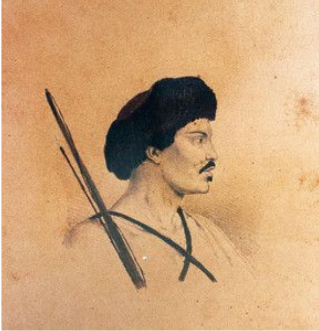
Índio vei-banj coroado, do aldeamento de São Pedro de Alcântara.

Fonte: Franz Keller, 1865, Newton Carneiro 1950 Iconografia paranaense, Curitiba. Impressora paranaense.