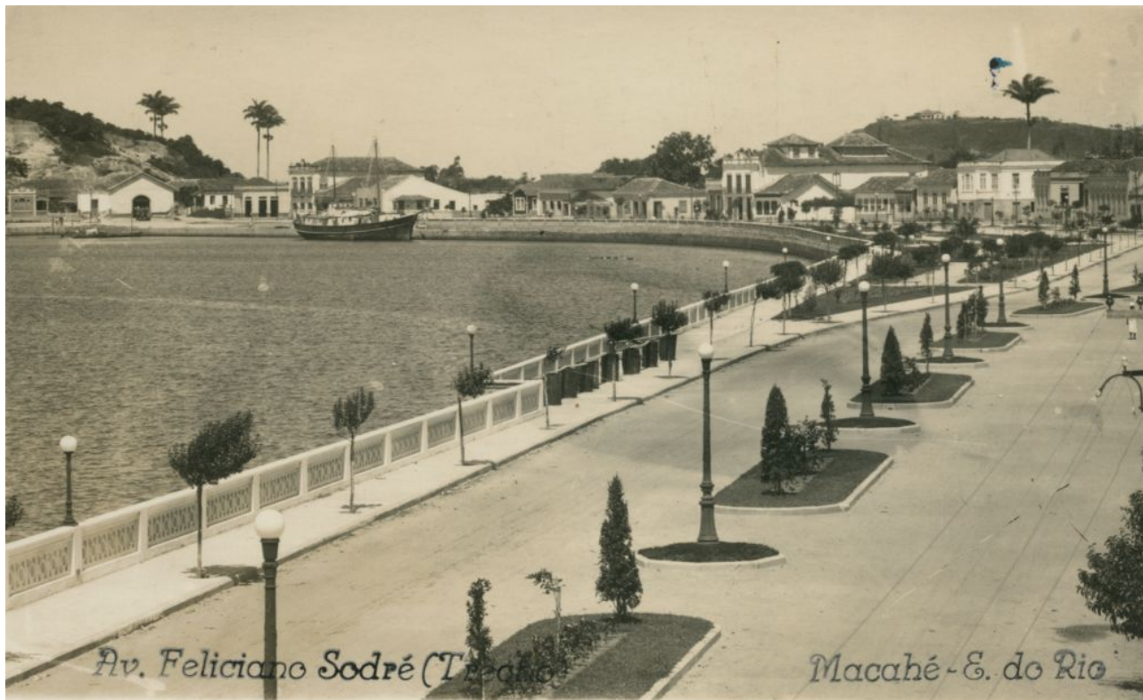
Imagem 01: Macaé em 1970