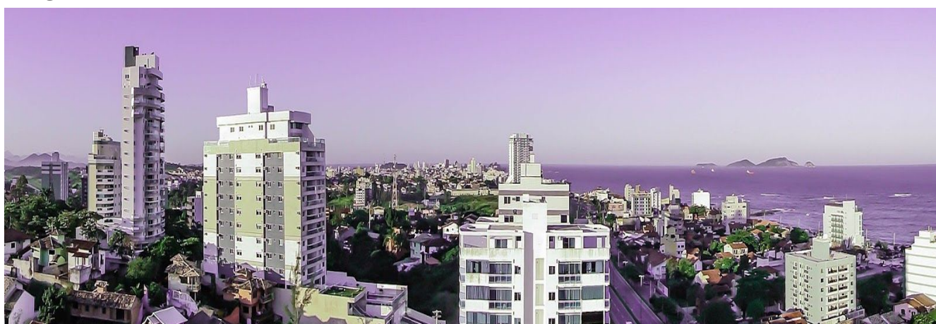
Imagem 02: Macaé 2011